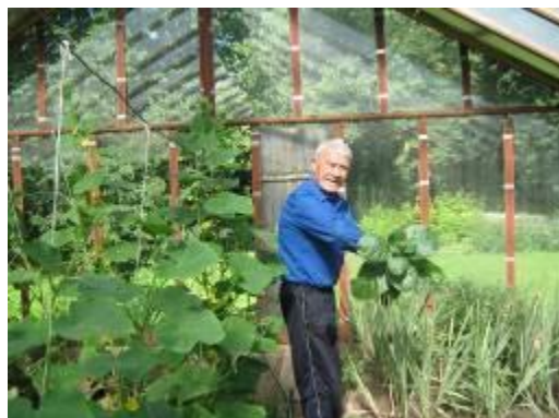
Ухаживают за зимним садом, аквариумом, попугаями.