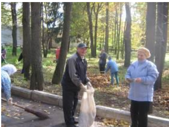
Помогают облагораживать территорию.